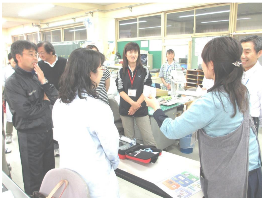
新 AED のミニ研修