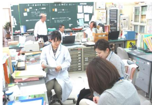
職員室でのOJTの様子