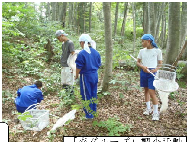
「森グループ」調査活動

と記述した。グループの他の生徒から、「昆虫の何を調べたいのかを具体的に」「環境保全の提言は昆虫を守る取組にするのか」といったアドバイスを得て課題を改善する必要性は感じたが、具体的な改善には至らなかった。そこで、課題設定面談の折に、教師が「もう一度、森とその周辺の見学・体験を振り返ってみよう」と呼びかけて一緒に見学し、体験活動で得た問題意識を確認するとともに、「昆虫も環境の中で生きている。昆虫にとって優しい環境の視点で、何か調べてみたいことはないか」と問いかけて課題設定の目的を明確にする等の支援を行った。