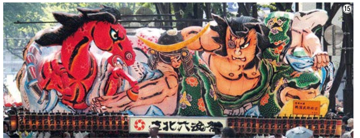
全国・世界各地からたくさんの支援を受けて 共に前に 歩み出す