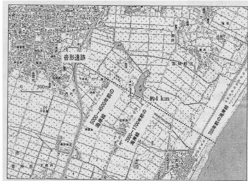
沓形遺跡の現在地を示す地図（仙台市博物館資料）

仙台市若林区荒井にある沓形遺跡 くつがた の発掘調査では、津波で運ばれた砂で埋まった弥生時代の水田が発見されている。遺跡は現在の海岸線から約4 km内陸にある。当時の海岸線からも2 km内陸にあることから、この津波では2 km以上先まで浸水したということになる。