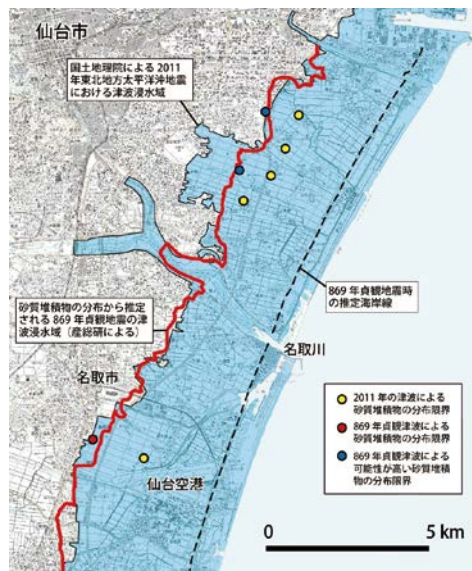
貞観地震と東北地方太平洋沖地震との津波浸水域の比較（穴倉正展著「次の巨大地震はどこか」宮帯出版社）

近年のボーリング調査によると、仙台平野の海岸では、当時の海岸線から2～4 km浸水したという分析結果も出ている。