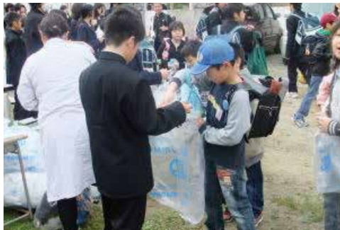
あいさつ運動やごみひろいをする小中学生