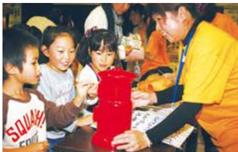
ほ金にきょう力する小中学生