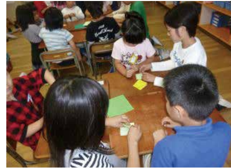
つるをおる小中学生

仙台市の学校では、毎年ふっこうへの思いをこめてつるをおったり、たんざくにメッセージを書いたりして、仙台七夕まつりでかざっています。