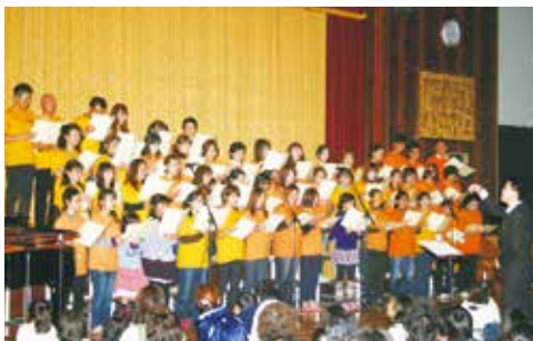
おんがくかいをひらいた地いきの人びと

ち地いきを明るく元気にするため、みんなが力を合わせ、おんがくかいなどのさまざまなイベントを行いました。