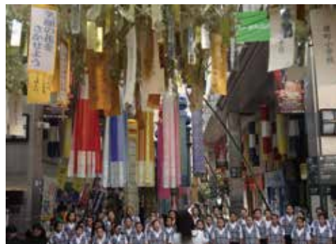
アーケードにかざられたメッセージ