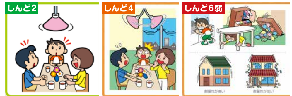
「しんど」とゆれ方