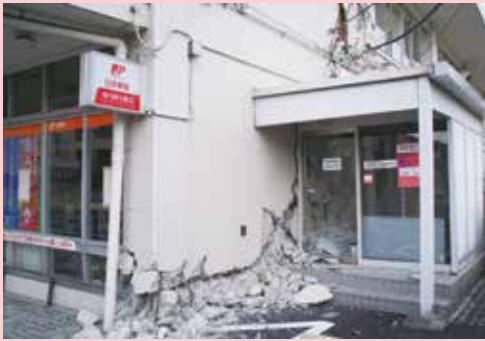
くずれたたてもの

地しんのゆれはどのようにつたわるのでしょうか。また、地しんのゆれ方には、どんなちがいがあるのでしょうか。地しんについてしらべてみましょう。