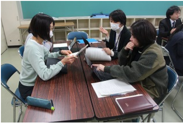
職員室 | - | -