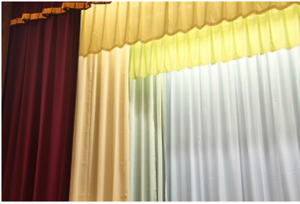
職員室 | - | -