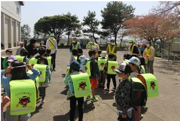
1年 | - | -

連日、お子さんの見守りをしてくださる地域の方々、保護者の皆様、ありがとうございます。