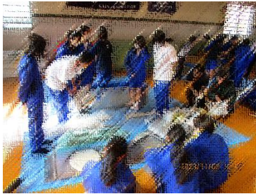
1年生:簡易トイレ設営

「災害は忘れた頃にやってくる」と言います。震災から10年以上経ち、「震災の記憶がない」「震災後に生まれた」生徒が多くなっている今こそ、いざというときに、焦らず安全に命を守る行動ができるよう訓練していくことが大切です。今後も、継続的に生徒たちに防災について考えたり体験したりする機会を設けていきたいと考えております。