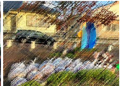
地区清掃後の公園

午後には、集団下校を行った後、各町内会の方たちにご協力をいただいて地域清掃に取り組みました。清掃後は公園だけでなく、生徒たちもすっきりした気分で下校できました。