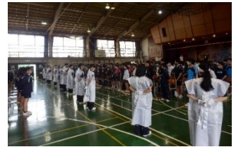
激励会 今年4年ぶりに全校生徒がエールを送りました。