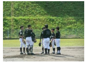
野球部の活躍を、応援生徒の演奏や声援が後押ししました！！