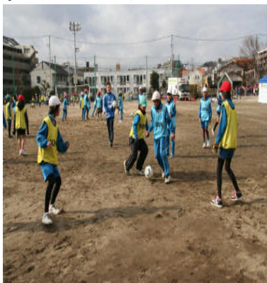
JFAサッカー教室(1月17日)

平成24年1月30日 仙台市立長町南小学校 TEL:247-3335 児童数:788名