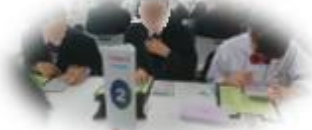
ファイナンスパーク

10月15日(月), 16日(火)に AER8 階の「仙台子ども体験プラザ」で年収, 家族構成などの条件を与えられ, 家計シミュレーションを体験してきました。親のありがたさ, 大変さを実感することができました。