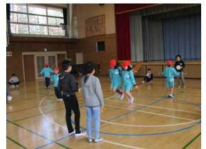
Web縄跳び 業間の時間に運動委員会を中心に開催しています。どの学年も一生懸命に取り組んでいます。