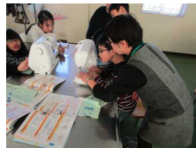
ミシンの授業（5年生） 地域の皆様に手伝ってもらいながら、ミシン縫いをしました。初めての子も多くいましたが、上手にできました。