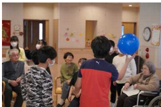
泉寿荘訪問（4年生） 地域にある老人ホームを訪問しました。子供たちは何をしたら喜んでもらえるかを考え、行動していました。