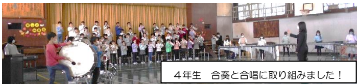
4年生 合奏と合唱に取り組みました！