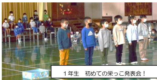
1年生 初めての栄っこ発表会！

学習や生活のまとめに教職員一同しっかりと取り組んでまいりたいと思います。今後も、保護者の皆様、地域の皆様には本校の教育活動に対し御理解と御協力をいただきますよう、どうぞよろしくお願いいたします。