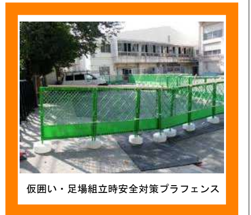
仮囲い・足場組立時安全対策プラフェンス