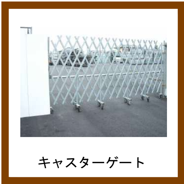
キャスターゲート