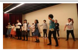
6年生修学旅行（ホテルにて）