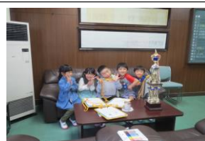
1年生学校探検（校長室で）