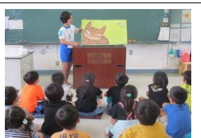
子どもポケット読み聞かせ