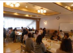
1年生保護者 給食試食会