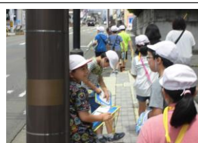
5年生総合学習（中山発展隊）