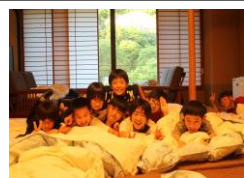
6年生修学旅行（ホテルにて）