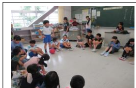
全校たてわり活動（児童会）