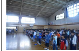
全校音楽朝会（今月の歌）