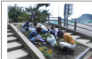
花壇づくり(環境育成委員会)