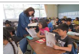
3年生フレッシュ先生研究授業