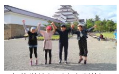
6年生修学旅行（自主研修）