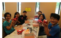
6年生修学旅行（自主研修）