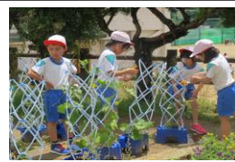
2年生生活科（栽培活動）