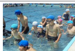
1年生プール開き（6年生）