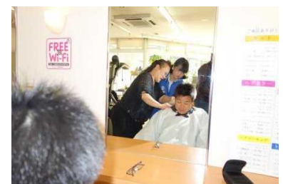
理髪店での学習の様子

3日間の活動を無事に終えることができたのは、各事業所でしっかりと指導してくださった方々と保護者の皆様のご協力のおかげと存じます。心から感謝申し上げます。