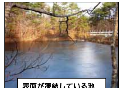
表面が凍結している池

もうすぐ新しい年の幕開けです。先月下旬には、冬季利用団体の代表者の方々への説明会が終わり、事前の打ち合わせが完了しました。人気の「歩くスキー」や「スノーシュー」といった冬季プログラムの用具の手入れや活動準備、環境整備のおおよそは終了しました。あとは、たくさんの雪と利用者の皆様のお越しを待つばかりとなりました。