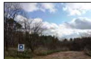
ギラッパコース入口付近