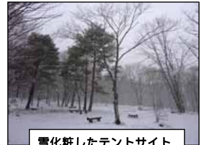
雪化粧したテントサイト

二十四節気の一つ「大雪」を過ぎ、平成23年も年の瀬を迎え、少年自然の家周辺では朝晩寒い日が続いています。11月16日の初冠雪以来、断続的に雪が舞い落ちる日が多くなり、いよいよ本格的な冬の訪れを予感させます。うっすらと雪化粧をし、「冬服」をまとったテントサイトや水面が凍りついた池を見ると、明るい色とりどりの草花が咲き誇り、子どもたちが元気いっぱい走り回っていた頃とは、まるで別世界です。生命の活力みなぎる春から秋の季節は当然魅力的ですが、静寂とモノトーンの色に彩られた野山やその中でひっそりと暮らす生き物たちにも風情を感じます。