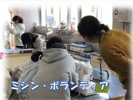
ミシン・ボランティア