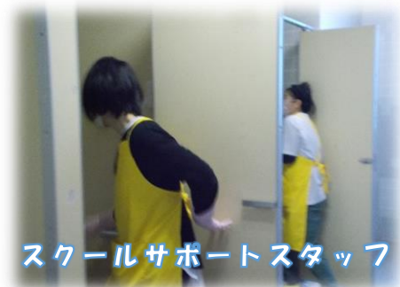
スクールサポートスタッフ