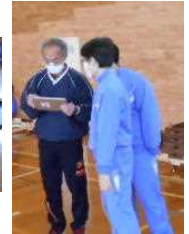
自分の演技を確認中→