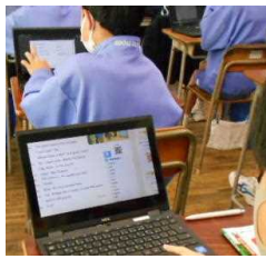
音声読み上げ機能の活用