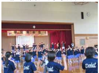
学習発表会（パプリカダンス）