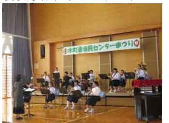
木町通市民センターまつり