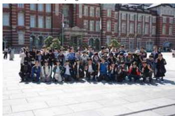
修学旅行（東京方面）

5月には、新型コロナウイルスが5類に移行され、4年振りに開催することのできた行事も多くありました。学習発表会での実行委員企画で「パプリカダンス」を全校生徒が踊った場面では、二中生全員が一つになった瞬間が生まれました。企画した実行委員や生徒会執行部のメンバーはもちろん、すべての生徒が成就感を持ってました。そして、先日の卒業式では、御来賓や保護者の方々に見守られながら胸を張って旅立つ3年生を見送る1・2年生全員の姿に「次は自分たちなんだ」という意気込みを感じ、生徒たちの成長を実感できた場面でした。1年間、様々な場面での御支援に、心より感謝申し上げます。