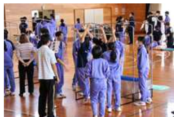
地域合同防災訓練