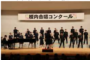
校内合唱コンクール