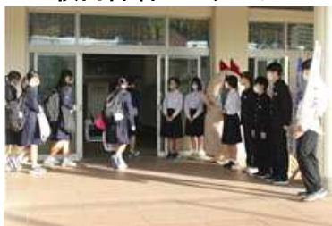
朝のあいさつ運動