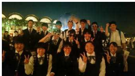
【TDSでみんなでチーズ!】