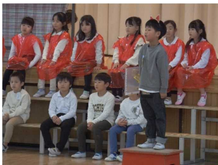
1年生「サラダでげんき」 緊張した表情で元気な声を響かせました

ご家族のお励ましがあったからこそ子供たちの成長です。「お父さんお母さん来てくれたよ」「お家で、ここを褒めてもらったよ」とうれしそうに報告する子供たちの顔から、子供たちのエネルギー源は、やはりお家の方からの温かい言葉であることを感じました。これまでの取組に対し、ご理解とご協力をありがとうございました。