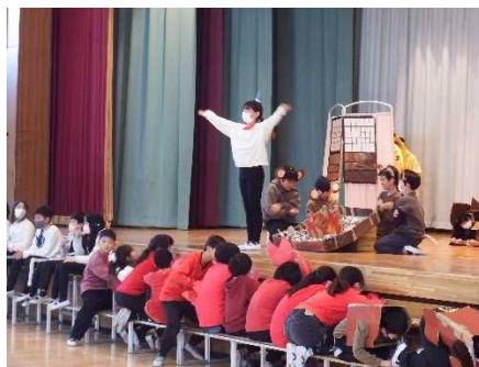
5年生「英語劇」さるかに合戦 堂々とした台詞と全員で仕上げた劇でした