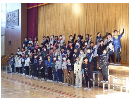
4年生「For You」 手話と歌声で会場の皆に笑顔を届けました