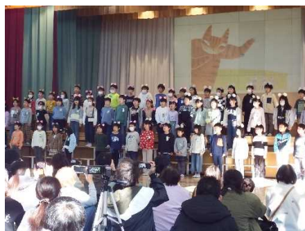
2年生「ニャーゴ」 歌が大好き2年生!本番の歌声も素敵でした