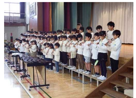
3年生「笑顔をメロディーに乗せて」 楽しくと美しく。種類の違う歌声を披露しました