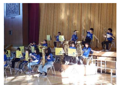
合奏団「心に響け沖東ハーモニー」 今回もオープニングを飾った合奏団です