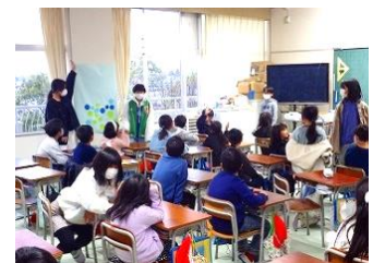
下級生との距離も近付いています