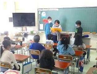
顔合せの会説明する声も震えます

沖野東小学校では、「交流活動の充実により思いやりの心を育てる」ことを大切にしています。この数年コロナ禍での諸活動の制限により直接体験が少ない状況が続いてきました。少しずつ日常を取り戻している今年、「思いやりの心」を育み、いじめのない学校づくりを進めていくために、「たてわり活動～フレンドリータイム～」を復活させました。リーダーとして事前準備をしたり下級生の前に立って指示をしたりする6年生は、とても頼もしいものです。困っている低学年の子の目線に降りてしゃがんで声を掛けていた高学年の優しさに、低学年の子の笑顔も増えています。直接の体験の中で様々な子供同士の関わりを作りながら、子供たちの自己有用感を高める工夫をしていきたいと思ひます。