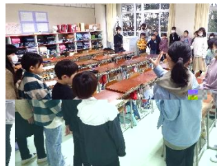
ゲームに動きも出てきました