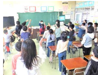
皆でゲームを楽しみました