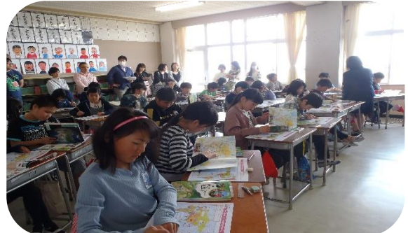
～5年生 社会「世界の中の国土」～

金曜日、子供たちは、朝からどこかそわそわして、おうちの方を心待ちにしていました。平日の授業参観でしたが、お仕事途中でいらしたお父さんの姿や、おじいさん・おばあさんの姿も見受けられました。廊下で参観されている方に「どうぞ中に。」と声を掛けたところ、