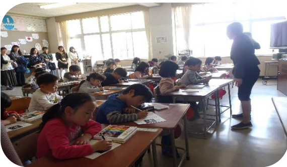
～1年生初めての授業参観「じをかごう」～

先日は授業参観にお越しいただき、ありがとうございました。お子さんの様子をご覧になり、いかがでしたでしょうか。