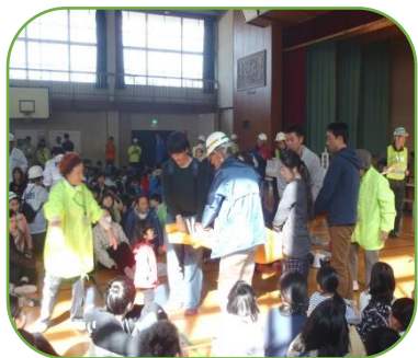
～毛布の担架で搬送訓練～