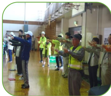
～血行を良くする予防体操～