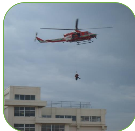
～消防ヘリ救助訓練～

先日の「沖野中学校区総合防災訓練」に際しましては、多数のご参加とご協力をいただき、ありがとうございました。『体験型』の訓練も3年目となり、全体的に、とてもスムーズに進行できたと思います。開会式の前の、婦人防火クラブの皆さんによる「応急手当訓練」や「搬送訓練」、中学生による「エコノミー症候群予防体操」など皆さんのご協力のおかげで、非常時の活動を確認しながら進めることができました。今年度は、消防ヘリコプターの救助訓練も見学し、貴重な体験をすることができました。お気付きの点や、ご意見・ご感想などがございましたら、遠慮なくお子さんを通じて学校の方へお寄せいただければと思います。よろしくお祈りします。