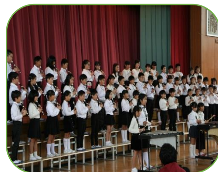
4年「幸せを信じて 自分を信じて」