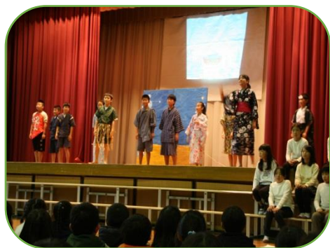
5年「浦島太郎de英語劇」