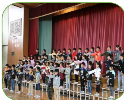
3年「友だちは みんな ここにいる」