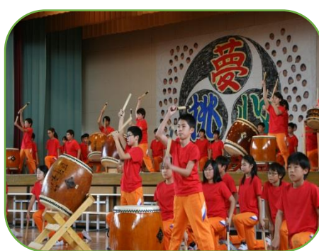
6年「沖東ぶち合わせ太鼓 『夢』」

わき起こったのを大変うれしく思いました。練習や発表会で培った力や自信を、今後の学習や生活に生かし、子供たちをより伸ばしていきたいと思えます。発表会についてのご感想やお気付きの点などがございましたら、ぜひお寄せください。