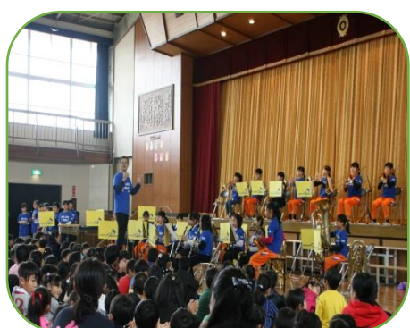
合奏団「心に響け 沖東ハーモニー」

先日のもみの木発表会には、ご多用の中たくさんの方々にお越しいただき、ありがとうございました。子供たちは、保護者の皆様や地域の皆様に見ていただきたく、毎日熱心に練習に取り組んできました。各学年、工夫を凝らし、せりふ・動き・群読・歌や合奏等、一つ一つに思いを込めて発表しました。閉会の言葉で、6年生が「いかがでしたか。」と聞いたときに、会場から温かい拍手が