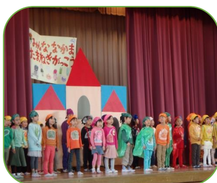
1年「みんな なかま たまねぎがっこう」