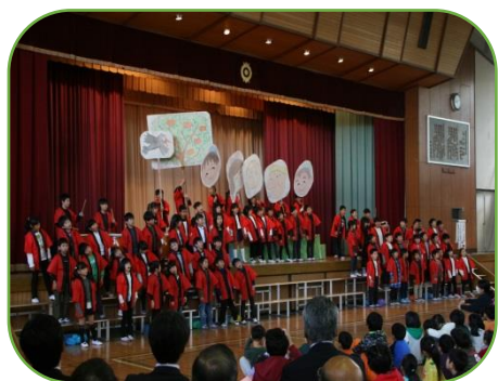
2年「うりこひめとあまのじゃく」