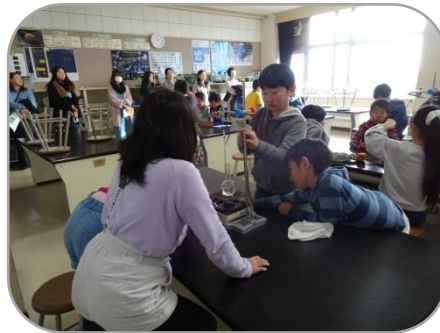
～4年理科「水のすがたと温度」～