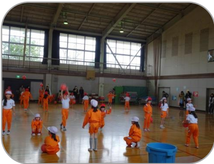
～2年体育「ボール投げゲーム」～

その後の懇談会は、参加がとても少なく残念でした。次回は2月に、今年度最後の授業参観と懇談会がありますので、ぜひご参加いただきますよう、お願い申し上げます。