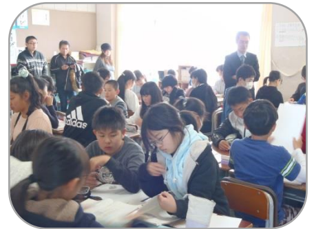
～6年国語「ヒロシマのうた」～