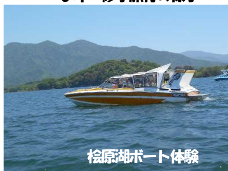
桜原湖ボート体験