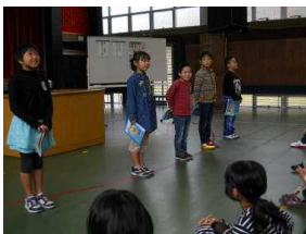
年生全員での発表)