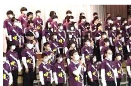
6年「ひびけハーモニー ~笑顔のために~」