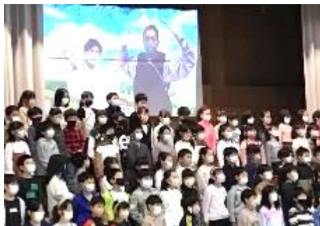
2年「わたしたちのまち つつじがおか」