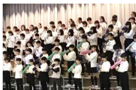
5年「仲間と奏でよう! 絆のシンフォニー」