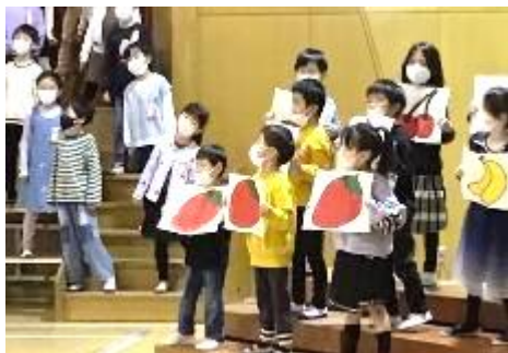
1年「ともだちっていいな」