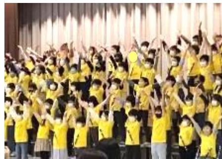
3年「小さな僕の大きな夢」