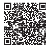
文部科学省のサイト