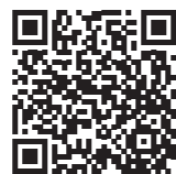
仙台市情報モラル教育推進事業

★総務省のサイト https://www.soumu.go.jp/use_the_internet_wisely/trouble/