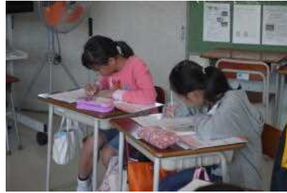
[自分の考えを書く]