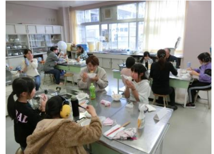
前日から準備のために御協力くださった5年 生保護者の皆様、ありがとうございました。