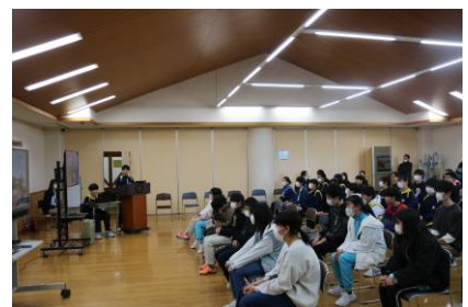
学校紹介といじめ防止「きずな」キャン ペーンについて話を真剣に聞いています。