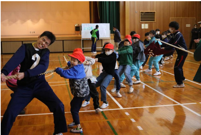
どの班も中学生の盛り上げがとても上手で、みんな綱引きに熱中していました。

全校児童が広陵中学校にバスでお出かけし、交流学习を行いました。前半は6年生が中学1年生との英語の合同授業に参加しました。現在、小学校では5年生から外国語の教科の授業として英語の学習を行っていますが、やはり中学校での授業は一味違う様子で、緊張感が漂っていましたが、入学前にとってもいい経験になったようです。後半は全校児童が中学校全校生徒と体育館で6班に分かれ、色別対抗総当たり綱引き大会を行いました。最後まで優勝チームが分からない白熱の展開で、中学生の盛り上げもあり、体育館は熱狂の渦に包まれました。両校の関係の良さを再確認できる、とても素敵な1日になりました。ありがとうございました。