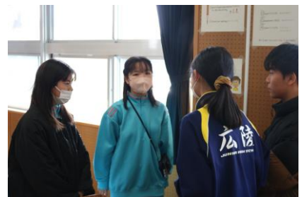
中学生と英語でコミュニケーションが とれたかな？