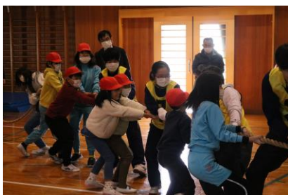
中学生を中心に並び方を相談しながら勝負です。