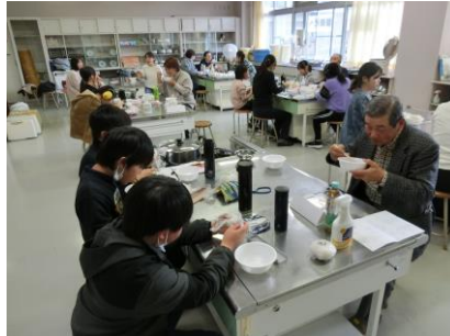
おいしいおにぎり、最高5個食べた児童も いたようです。