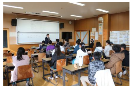
「中学校の英語の先生はどんな人だろう？」 と思いながら授業を受けていたようです。