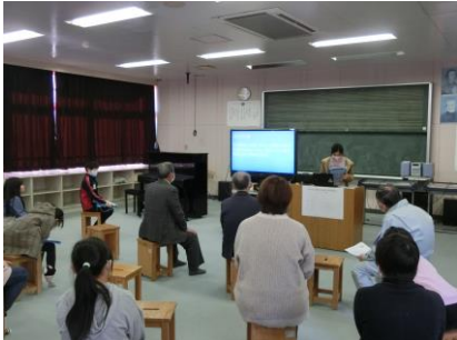
各々のテーマについて、クロームブックの スライドを使ってまとめ、発表しました。

毎年行っている「収穫を祝う会」が行われました。上愛子小学校の学校田で作られたお米。今年もライスフィールド事業の協力者の皆様のおかげで大豊作でした。この日は5年生が招待した協力者の皆様を囲んで、お米について調べたことを発表したり、一緒に収穫したお米で作ったおにぎりや豚汁をいただいたりしました。来年も収穫が楽しみです。