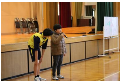
6年生代表が感想と感謝の言葉を述べました。