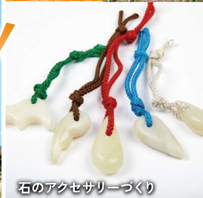
石のアクセサリーづくり