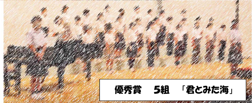
優秀賞 5組 「君とみた海」

惜しくも賞を逃したクラスもみんな、全力で頑張りました☆ 去年より成長した歌声、いかがでしたか！？