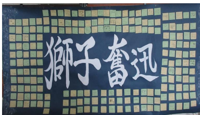
＜3学年の決意表明&応援メッセージ＞ (美術部・科学部が掲示物を作成しました)