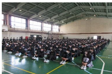
【着任式・始業式の様子】 どの学年も整然と式に臨みました

今年度の本校の学校重点目標は、「確かな学力の育成」と「ゆたかな社会性の育成」の二つです。保護者の皆様、地域の皆様の御理解と御協力のもと、家庭と地域、学校がともに手を携え、子どもたちの健全な育成を目指し、教職員一丸となって取り組んでまいります。今年度も、御支援のほどよろしくお願いいたします。