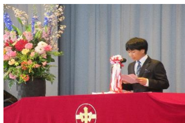
【新入生誓いのことば】 堂々と誓いのことばを述べました