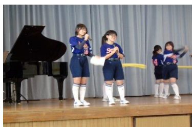
【部活動紹介①運動部】 どの部も工夫を凝らしたパフォーマンスを展開しました