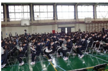
【対面式の様子】 「一中説明書」を見ながら説明を聞きました