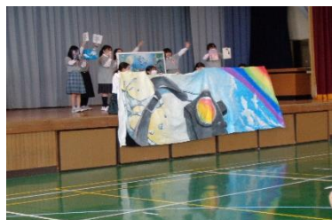
【部活動紹介②学芸部】