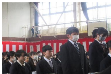
【入学式・新入生呼名】 しっかりと返事ができました