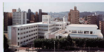
現在の五橋中 (東側より)