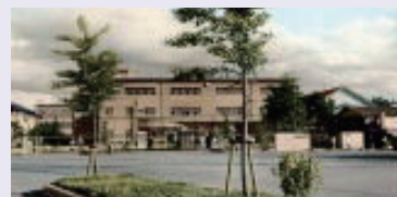
旧校舎 (昭和30年代) 北側より