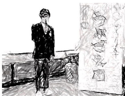
閉会のあいさつ：○○○○さん(1組)