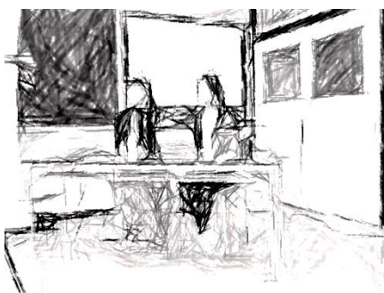
「うぶごえ座」の講師