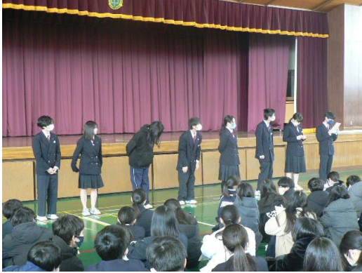
学年委員からの話

4月からは、1年生に信頼されること、3年生から安心して任されることが期待されます。まさに中堅学年です。