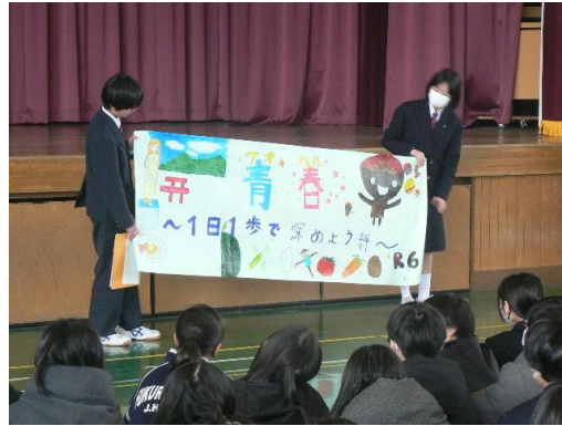
野外活動実行委員によるスローガン紹介とルール説明