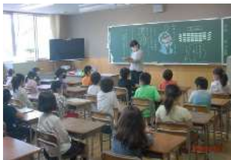
朝の健康観察「健康チェックカード」のご記入ありがとうございます。

今週は、午前授業となります。放課後安全に生活するようご家庭でもお声掛けください。