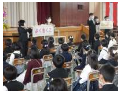
入学式「なかよくする子」「よくきく子」 「がんばる子」になろう！