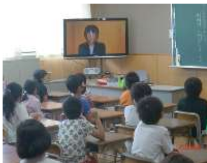
始業式はテレビ放送 お話をしっかりと聞く子供たち。