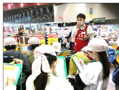
真剣にメモを取る子供たち

店員さんには丁寧に色々なことを教えていただき、見学を通してお店で働いている方々の工夫や思いを知ることができました。倉庫や生鮮・精肉などのバックヤードの裏側にも案内され、初めて足を踏み入れる場所に子供たちは目を輝かせていました。見学をして気付いたことや分かったことなどメモをしながら、スーパーマーケットがどんな工夫をしているのか理解を深めることができました。