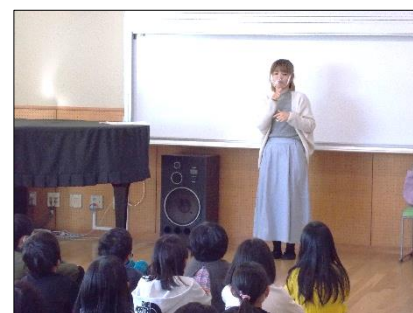
手話でつながる世界に興味津々

今回の学習は、当事者の立場に立った社会福祉の大切さを考える貴重な機会になりました。