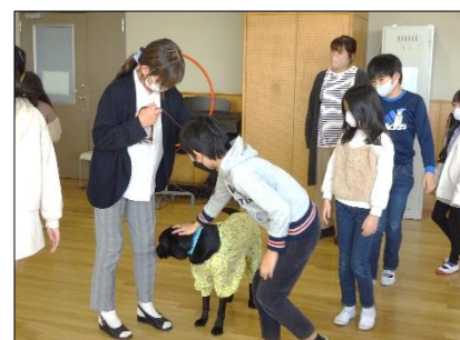
盲導犬「コナンくん」との触れ合い