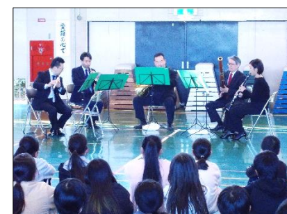
管楽器の美しい音色が響きました

ユーモアを交えた楽器の紹介や、金管五重奏による名曲披露など、臨場感たっぷりのぜいたくな時間を過ごした5年生。目の前で繰り広げられる演奏の生の迫力を全身で感じ、曲に合わせて体を揺らしながら聴き入る子もいました。