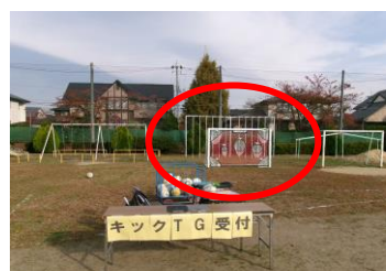
←こちらが寄贈のフットサルゴールです。