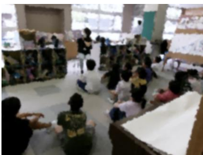
←こちらは、朝の読み聞かせの時間の様子です。

桂小学校では、「読み聞かせボランティア」の方々に、物語や民話、絵本の読み聞かせなどを国語科の読書指導の一貫として行っていただいています。