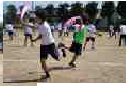
<応援に狂喜乱舞の2人>