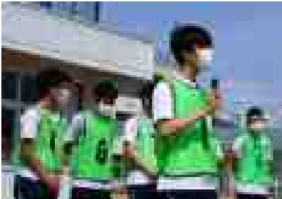
<進行に励む学年委員さん>