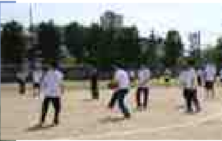
<男子のドッジビー>