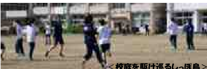
<校庭を駆け巡るしっぽ鳥>