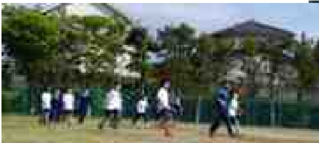
<パフォーマンス勝負のだるまさんが缶蹴り>