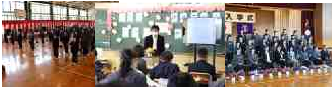
<入学式後の1組の学活>