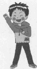
すこプラ推進キャラクター 「まもるくん」