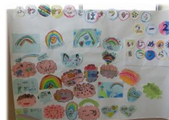
「いじめ防止きずなキャンペーン」 2年生「ふわふわ言葉」の取組

来週はフリー参観があります。4月からの学習のまとめをしっかりと行い、充実した気持ちで夏休みを迎えられるよう指導して参ります。御家庭でも引き続き御支援をよろしくお願い申し上げます。