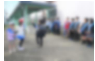
6のつく日は挨拶デー

今後も保護者や地域の皆様と力を合わせて、子供たちが楽しく元気に学校生活を送ることができるよう、教職員一同力を尽くしてまいります。今度もどうぞ御理解と御協力をお願いいたします。